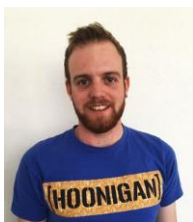
Bar & Grill Ramon Arnold